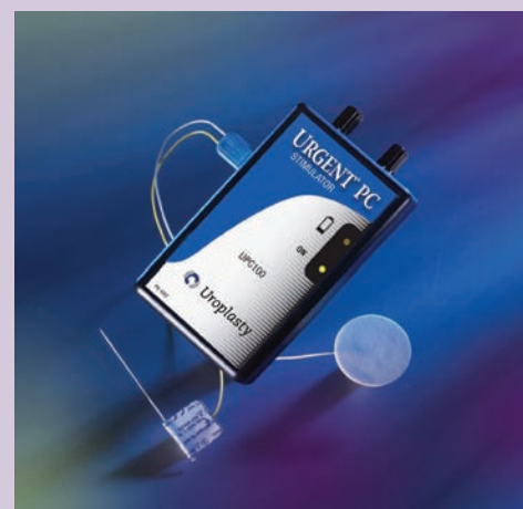
Sistema di neuromodulazione Urgent PC