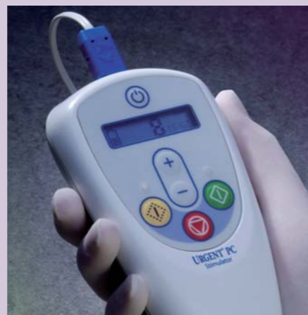
Urgent® PC neuromodulatiesysteem