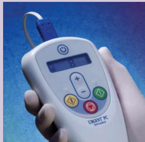
Sistema de Neuromodulación Urgent PC

Pregunte a su médico si la PTNS es adecuada para usted.